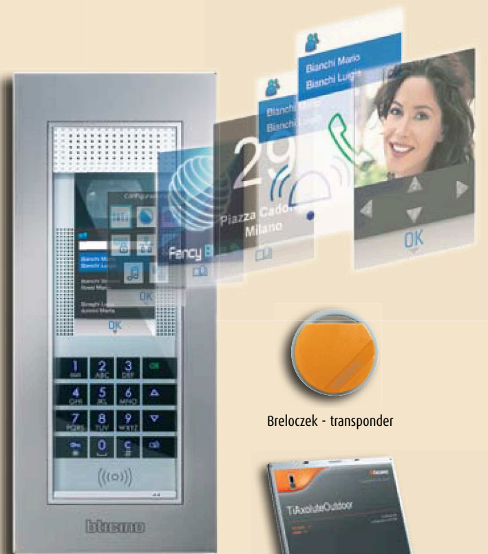
Breloczek - transponder