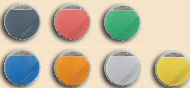
Transpondery - breloczki