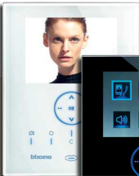
Video Station Whice

AXOLUTE Nighter i Whice w połączeniu z panelem zewnętrznym AXOLUTE OUTDOOR to funkcjonalna i estetyczna rewolucja w systemach wideodomofonowych.