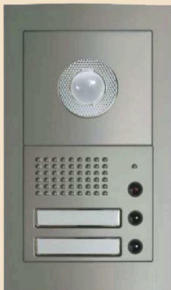
Panel z modułem fonicznym i modułem kamery