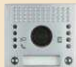
Plakietka z dwoma przyciskami