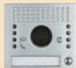
Plakietka z jednym przyciskiem