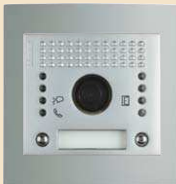
Panel z nowym modułem fonicznym z kamerą

Kompaktowa konstrukcja, to oszczędność przestrzeni, czasu i materiałów.