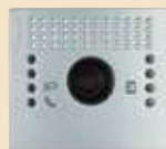
Plakietka bez przycisku